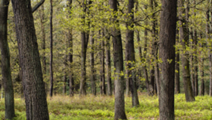
Kiefern-Traubeneichenwald im Frühjahr